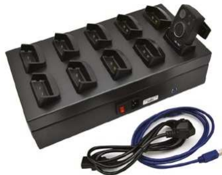
10portová dokovací stanice Kód: 2003-127 Cena: 21 054,- vč DPH