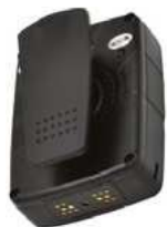
Zadní pohled na kameru s upevňovacím klipem