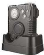
Dokovací stanice pro nabíjení a přenos dat (součást balení)

Čím se liší: nabíjení USB-C, stativový závit, stabilizace obrazu EIS, PC management SW, indikace stavu baterie.