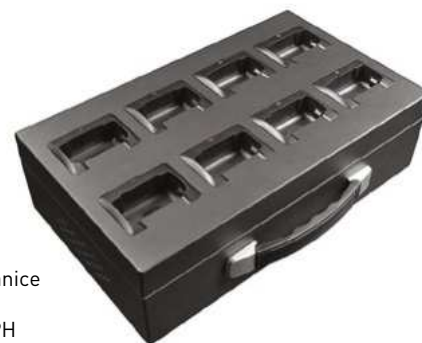
8portová dokovací stanice Kód 2103-021 Cena: 21 054,- vč. DPH