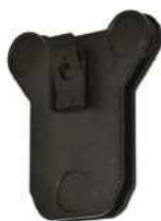
Univerzální magnetický držák Kód: 2105-119 Cena: 1 210,- vč. DPH