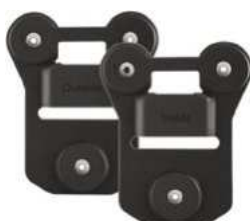
Univerzální magnetický držák Kód: 2408-046 Cena: 1 089,- vč. DPH