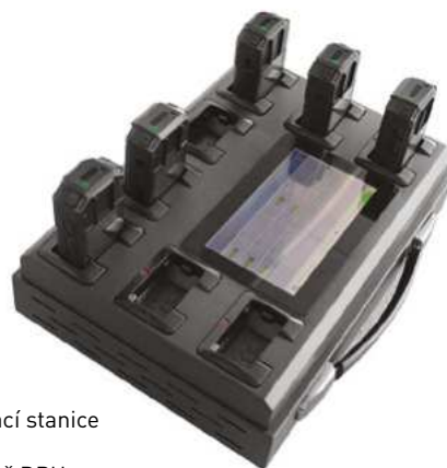
8portová dokovací stanice Kód: 1911-014 Cena: 44 165,- vč. DPH