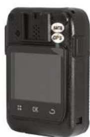
Zadní pohled na kameru