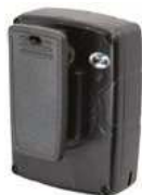
Zadní pohled na kameru s nabíjecími piny a klipem