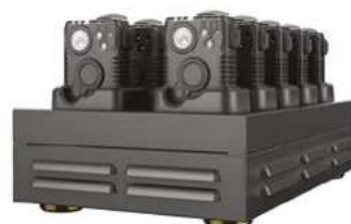
10portová dokovací stanice Kód: 2310-055 Cena: 21 054,- vč DPH