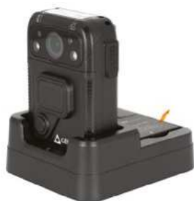
Dokovací stanice pro přenos dat a nabíjení kamery a baterie (součást balení)