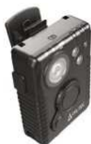
Přední pohled na kameru, indikační LED v horní části.