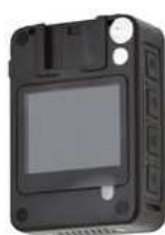
Zadní pohled na kameru