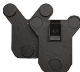
Dvoudílný magnetický držák Kód: 2105-119 Cena: 1 210,- vč DPH