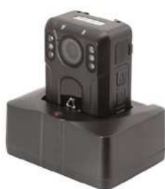
Dokovací stanice pro přenos dat (součást balení)