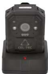
Dokovací stanice pro nabíjení a přenos dat (součást balení)

Čím se liší: pogumované tělo, robustní provedení.