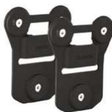
Univerzální magnetický držák Kód: 2408-046 Cena: 1 089,- vč. DPH