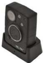
Dokovací stanice pro nabíjení a přenos dat (součást balení)