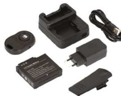
Dokovací stanice, USB-C/USB-A kabel, adaptér do zásuvky, klip na kameru, náhradní baterie, dálkový ovladač (vše součástí balení)