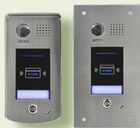
VHC-1-R (povrchová montáž) VHC-1-R-ZAP (zápustná montáž)