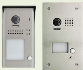
VHC-1 v2 (povrchová montáž) VHC-1-ZAP (zápustná montáž)

1 – 4 samostatné vstupní dveře, až 12 paralelních vnitřních jednotek VIDEOTELEFON PRO KONTROLU VSTUPU DO OBJEKTU