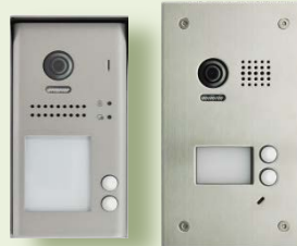
VHC-2 v2 (povrchová montáž) VHC-2-ZAP (zápustná montáž)