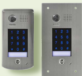
VHC-1-KL (povrchová montáž) VHC-1-KL-ZAP (zápustná montáž)